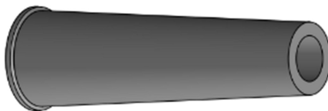
Figure 1 : Vue 3D